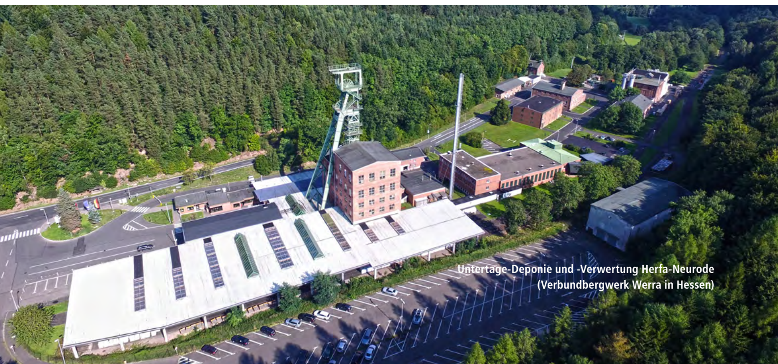
Untertage-Deponie und -Verwertung Herfa-Neurode (Verbundbergwerk Werra in Hessen)

Bei einer untertägigen Verwertung werden die vorhandenen Hohlräume in Bergwerken mit diesen Rückständen verfüllt und damit langzeitsicher gesichert. Bei einer Beseitigung unter Tage wiederum werden die Rückstände sicher und nachsorgefrei deponiert.